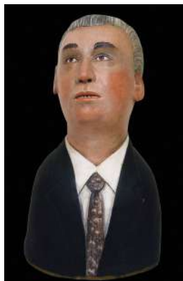
Giuseppe Gavazzi Busto di Luigi Dallapiccola 45 cm, terracotta, 2006. Firenze, Centro Studi Luigi Dallapiccola

Collocazione in Conservatorio di due busti in terracotta di Luigi Dallapiccola realizzati dagli scultori Giuseppe Gavazzi (2006) e Antonio Di Tommaso (2018) e donati al Centro Studi Luigi Dallapiccola