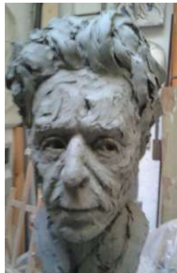
Antonio Di Tommaso Testa di Luigi Dallapiccola 40 cm, terracotta, 2018. Firenze, Centro Studi Luigi Dallapiccola