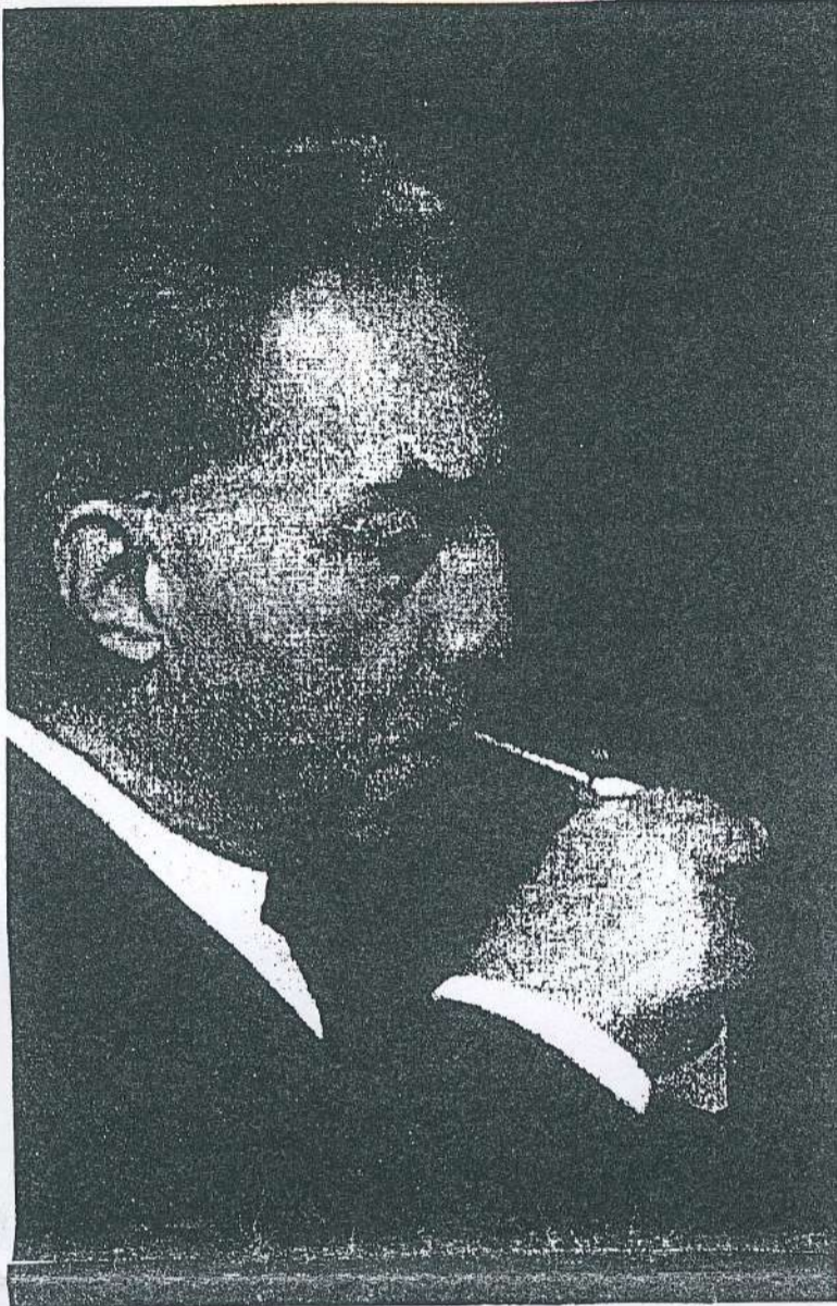
Die „expressionistische Verzweiflung“ überwunden: Dallapiccola.